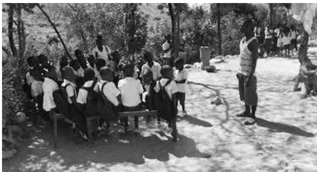
26 Kinder warten auf das Mittagessen. Schulsäcke, Schuhe und Uniformen gehören zum Projekt.

Es gibt zur Abgabe kein weiteres Programm. Das wäre auch falsch am Ende eines Schultages. Das Essen wird in der Küche vorge-