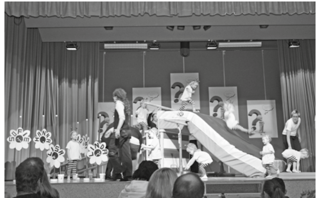
Die Muki-Kinder am Turnerkränzli 2015.

Ich möchte es jedoch nicht unterlassen noch einige Worte dazu hinzufügen. Auch bei mir ist der Montagmorgen ein fester und sehr wichtiger Bestandteil der Woche. Es gibt so viel berührende Momente, die ich am liebsten jedes Mal mit einer Filmkamera festhalten möchte, damit ich sie immer wieder geniessen kann. So aber konzentriere ich mich an Ort voll und ganz auf die bezaubernden Kinder, die so rein, fröhlich und offen sind. Ihr Minenspiel fasziniert mich immer wieder aufs Neue und ab und zu würde