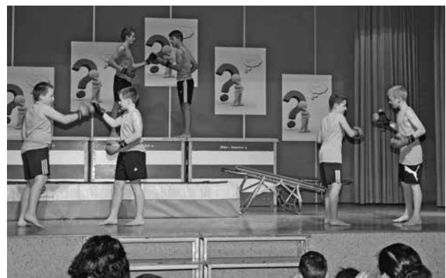
Die Knaben-Jugi am Turnerkränzli 2015.

Die kleinen Knaben hatten ihren Auftritt mit den Mädchen. Im weissen Hemd mit Krawatte, schwarzen Hosen und Leuchtbrillen ernteten sie vom Publikum viel Applaus. Die grossen Knaben demonstrierten ihre Fitness zum Lied «The Tiger» vom Film «Rocky 4».