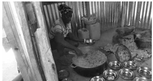
Zubereitung des Essens durch unsere Köchin.

Werner Rolli ist mit Schaukelaufhängungen, die mit Kugellagern versehen sind, nach Haiti gekommen. Danke Werner. Das wird ein Renner werden.