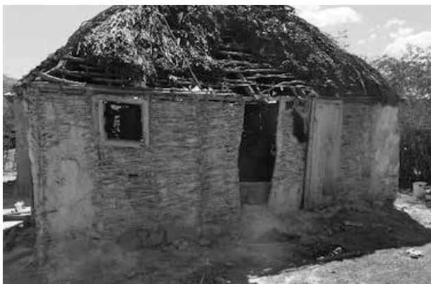
Armselige Wohnhütte in Jean Jules.

Es gibt zur Zeit (Trockenperiode von Ende November bis Ende April) in der ganzen Gegend kein Wasser. Die Leute müssen im Flussbett etwa 1m tief graben, dann finden sich dort kleine Mengen Wasser, von dem gesagt wird, es sei trinkbar. In Wirklichkeit