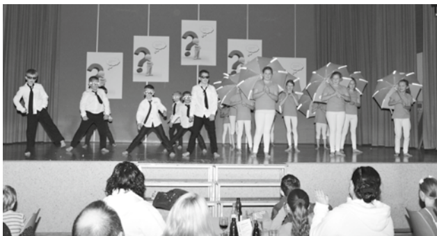
Die Mädchen-Jugi am Turnerkränzli 2015.