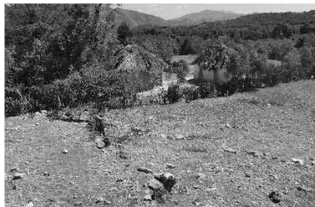
Ausgetrocknete Gegend der Siedlung Jean Jules.

Das gross aufgebauschte Projekt der Gratienseinschulung der unteren Klassen in den Primarschulen hat zu einem totalen Fiasko geführt, weil nur eine Handvoll auserlesene Schulen im Land das vom Staat versproche-